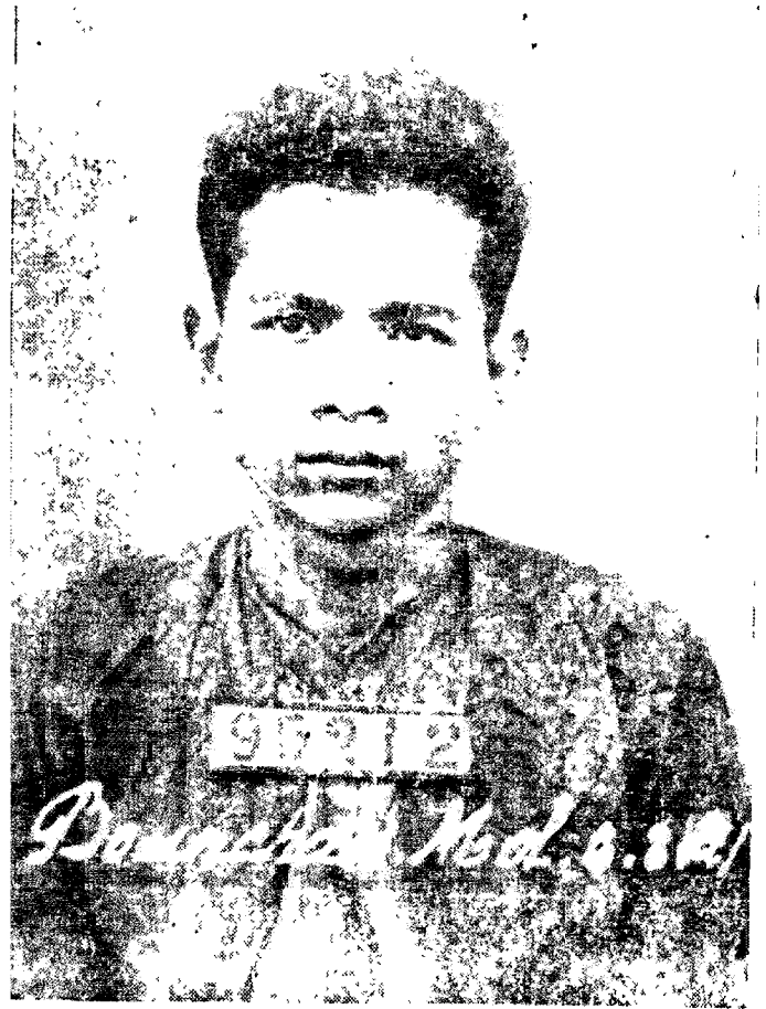
រូបថតកាតាល់នៅគុកធំភ្នំពេញ ថតនៅបន្ទីរក្រុមព្រះនគរធានា (ថ្ងៃទី ៦ កើត ១៩៥២)